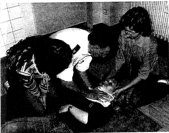
Den Befragten ist die Fortbildung ihres Teams besonders wichtig

Es wurden Fragen zu Umfang, Form, Referentenpräferenz und Finanzierung gestellt. Mehrfachnennungen waren dabei möglich. Hier stellen wir Ihnen die Ergebnisse der 5 Fragen, mit direkt anschließender Interpretation vor: